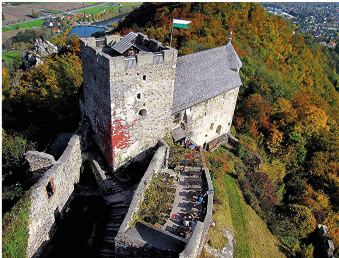
Untere Burg mit Tavernen-Gastgarten.