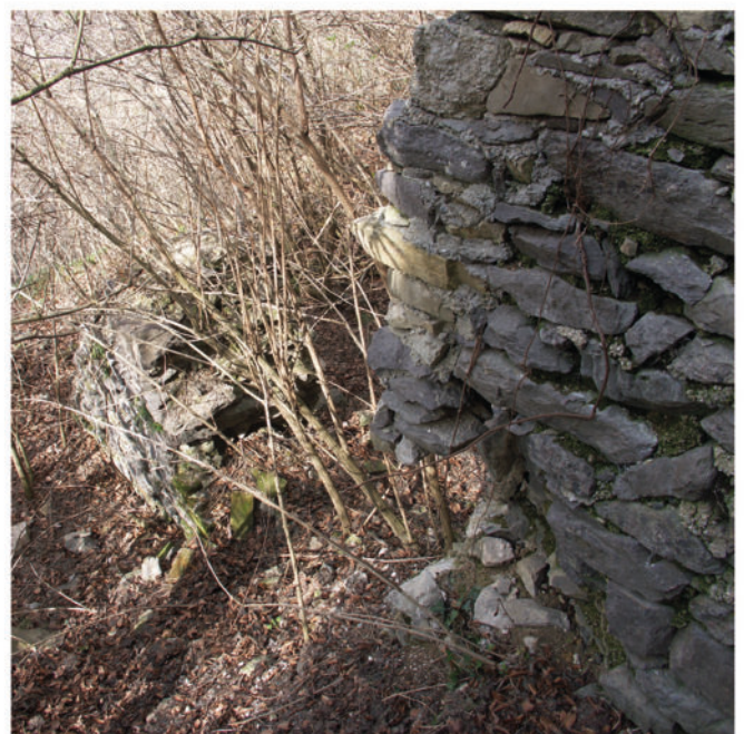
Defekte Stützmauer beim Großen Palas.