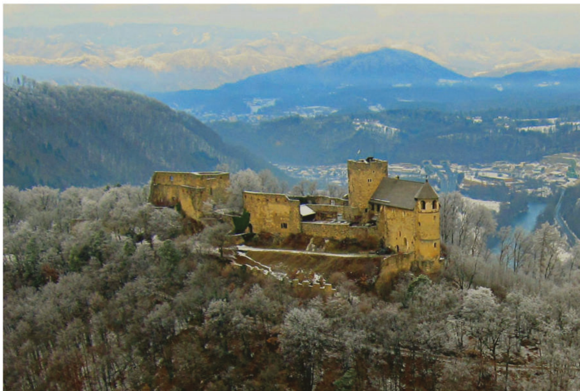
Gesamtansicht der Burg von Süden.