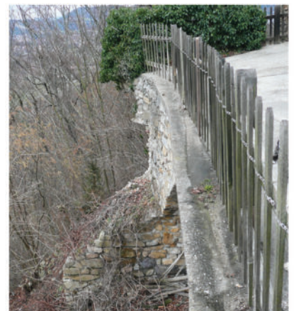
Ausbruch des Toilettendach-Stützpfieilers.

wegen ihres hohen Alters der Witterung sicher nicht ewig trotzen werden. Der Burgverein Gösting verweist abermals, wie schon seit vielen Jahren, auf die Dringlichkeit einer fundierten Sanierung, sachkundigen Sicherung und Erhaltung des alten Gemäuers , um dessen Stabilität dauerhaft zu gewährleisten und den Menschen auch für die Zukunft einen unbehinderten und gefahrlosen Aufenthalt im Bereich der wertvollen Burg zu ermöglichen.